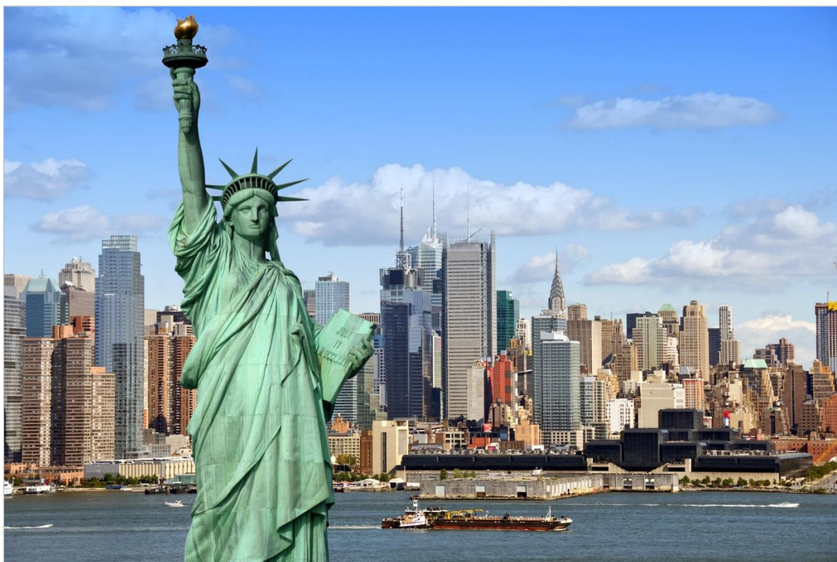
■ Statue de la Liberté