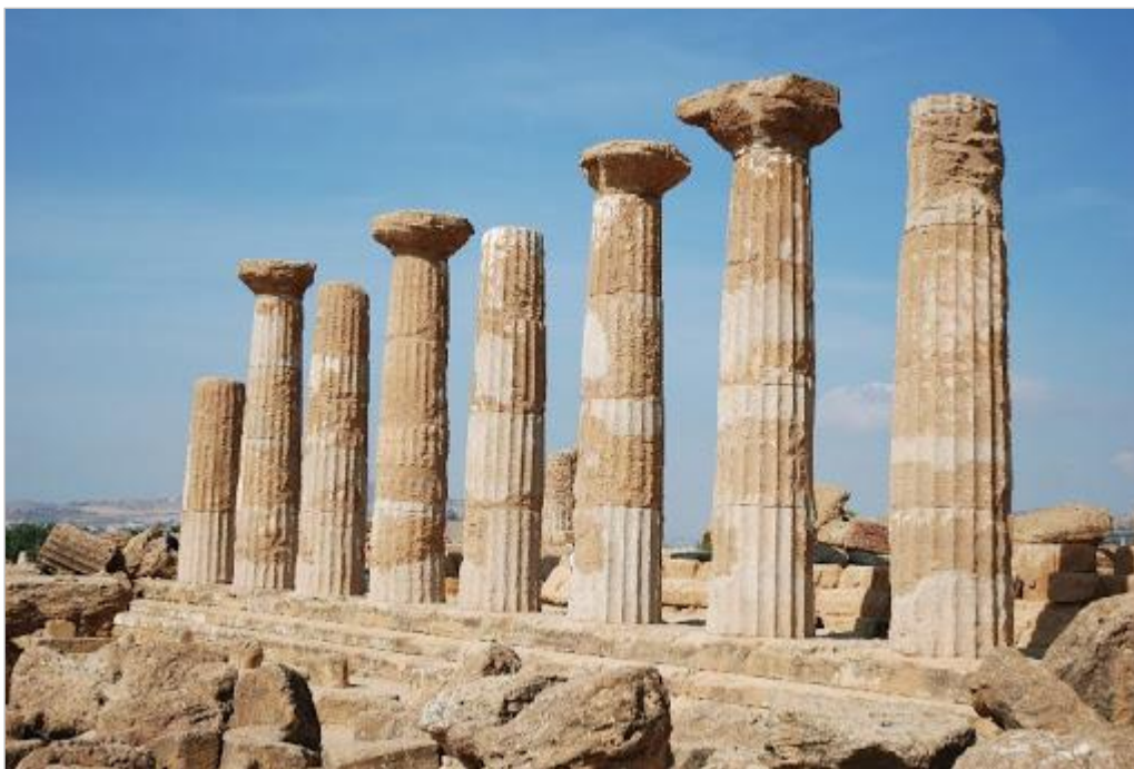
■ Temple d'Héraclès à Agrigente