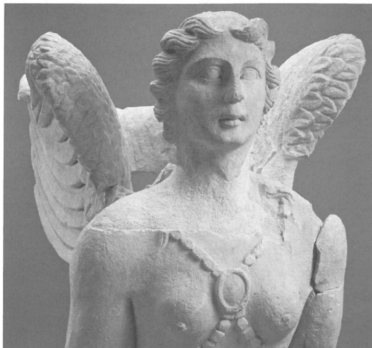
○ Fig. 6. Sphinge (99 03 DA 028 et DA 029), détail du torse.

descendent des épaules sur la poitrine, où ils se rejoignent entre les deux premiers seins par un médaillon arrondi, ils se dirigent vers le dos, où ils s'arrêtent sous la partie inférieure des ailes. L'avant-bras droit, brisé, est légèrement relevé, ce qui indique que la main était également posée sur quelque chose, probablement une tête humaine. Les ailes sont bien déployées, parallèles au corps et recourbées vers le haut à leurs extrémités. Le buste est assez puissant, le monstre a six paires de seins qui n'ont pas toutes reçu le même traitement. La première paire, mise en valeur par le pectoral et plus proche du visage est humaine, tandis que les autres se rapprochent davantage de l'aspect de l'anatomie animale.