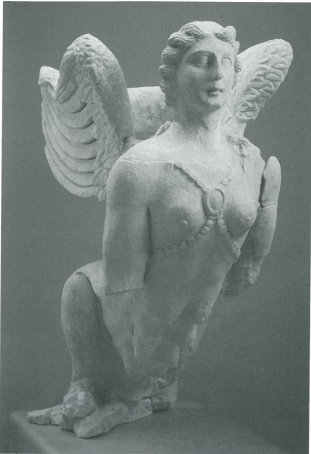
○ Fig. 2. Sphinge ( 99 03 DA 028 et DA 029), vue de trois quarts.