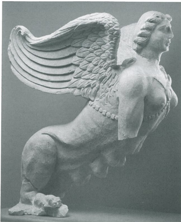
○ Fig. 4. Sphinge ( 99 03 DA 028 et DA 029), profil gauche.