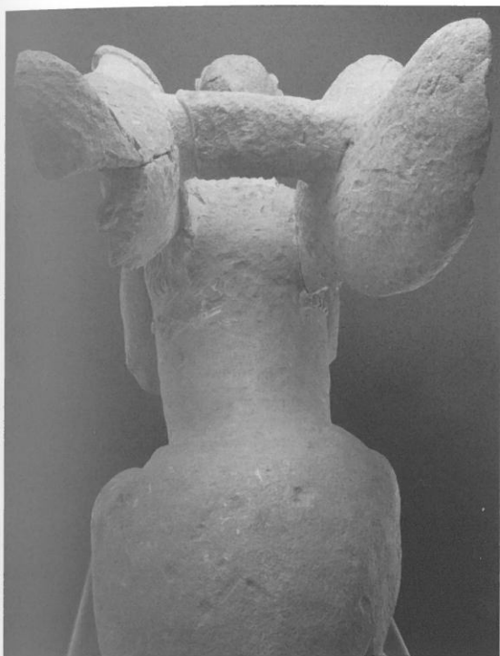
○ Fig. 5. Sphinge (99 03 DA 028 et DA 029), vue du dos.